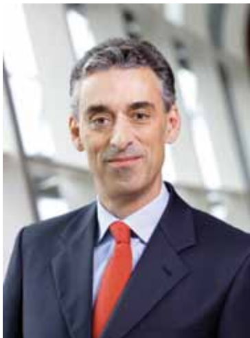
Франк Аппель генеральный директор Группы компаний Deutsche Post DHL

– В прошлом году мы, как и все, наблюдали существенное снижение объемов, наша выручка в 2008–2009 гг. упала, но весь последний год мы видим очень здоровое восстановление, которое стимулирует рост вашего (российского) рынка доставки внутри страны, а также общее восстановление мировой экономической си-